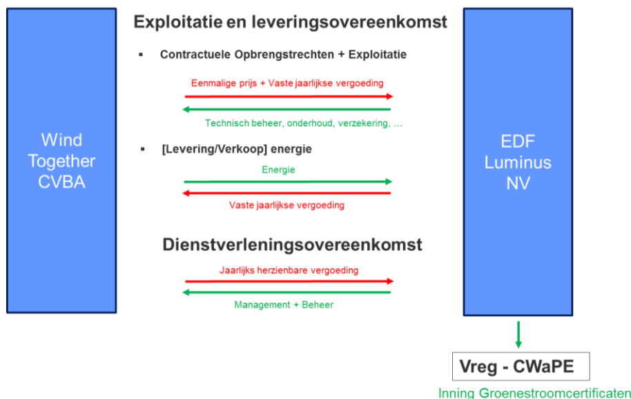
Figure 2 : aperçu de la structure d'EDF Luminus SCRL et des contrats